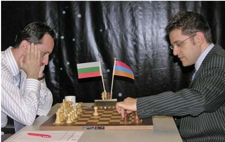
Topalov en Aronian bij het begin van hun enerverende partij uit de 10e ronde van Corus 2006