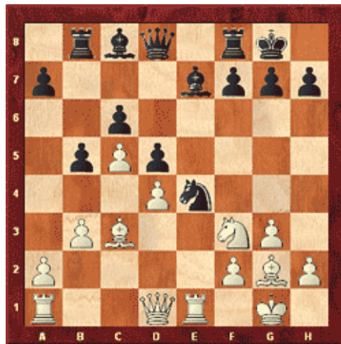
Stelling na 17. ... Pe4

Tot en met de 17 e zet verliep de partij vrij rustig. Het was allemaal theorie en al een eerder gespeeld in o.a. Kramnik – Leko, Dortmund 2004. Na 17 zetten is de stelling als volgt: