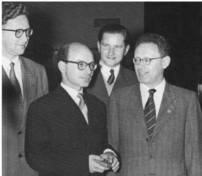
Vasily Smyslov, geheel links op de foto, met Bronstein, Keres en Botvinnik in 1954. Smyslov werd op 24 maart 85 jaar en is de oudste nog levende ex-wereldkampioen