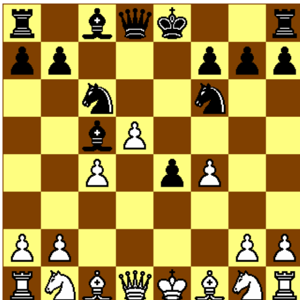
Stelling na 7. ... – Lc5!