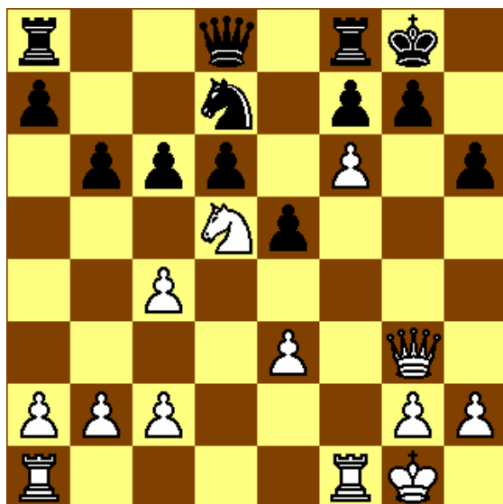
Stelling na 16. f6!