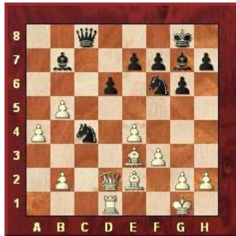
Stelling na 20. ... Pc4