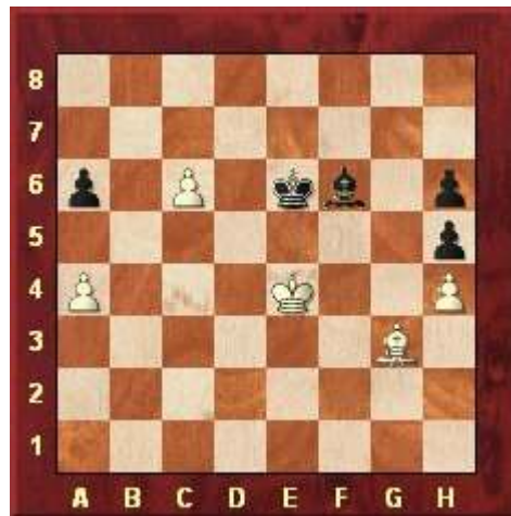
Slotstelling na 57. ... Lf6

Uit deze wedstrijd drie fragmenten. Allereerst de slotstelling uit de partij tussen Svidler (wit) en Van Wely aan bord 1. In onderstaande stelling werd remise overeengekomen.