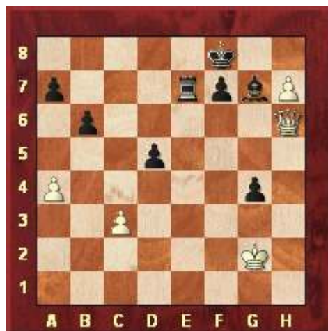
Stelling na 47. Dh6!!

Het tweede fragment komt uit de partij tussen Tiviakov en Dreev. Tiviakov (met wit) heeft zojuist 47. Dh6!! gespeeld waarna onderstaande stelling ontstond.