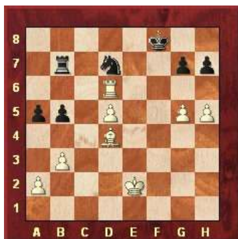
Stelling na 36. Ld4

(Commentaar van Rini Kuijf op de KNSB-site: “pion meer, superieure loper en aanval tegen de zwart koning. Zelden zal Akopian zo zijn weggespeeld”. Er volgde nog: